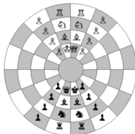
Position de départ des échecs byzantins.